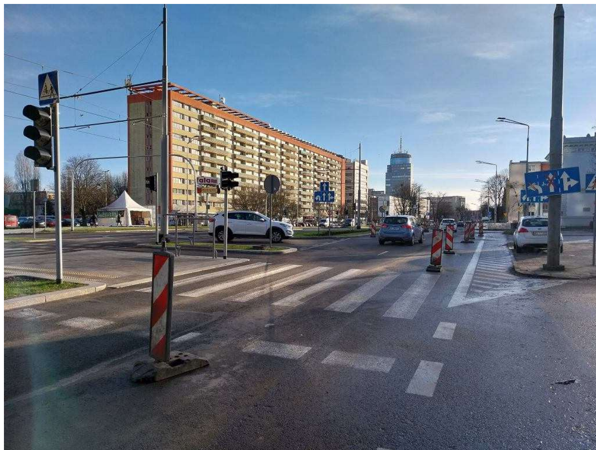
Chodnik i część jezdni w rejonie pl. Witosa wciąż czeka na przebudowę

Mówiąc w uproszczeniu: budujący Hanza Tower – wieżowiec, który ma niebagatelny wpływ na ruch w tej części miasta – zobowiązał się, że będzie współuczestniczył w przebudowie części skrzyżowania.