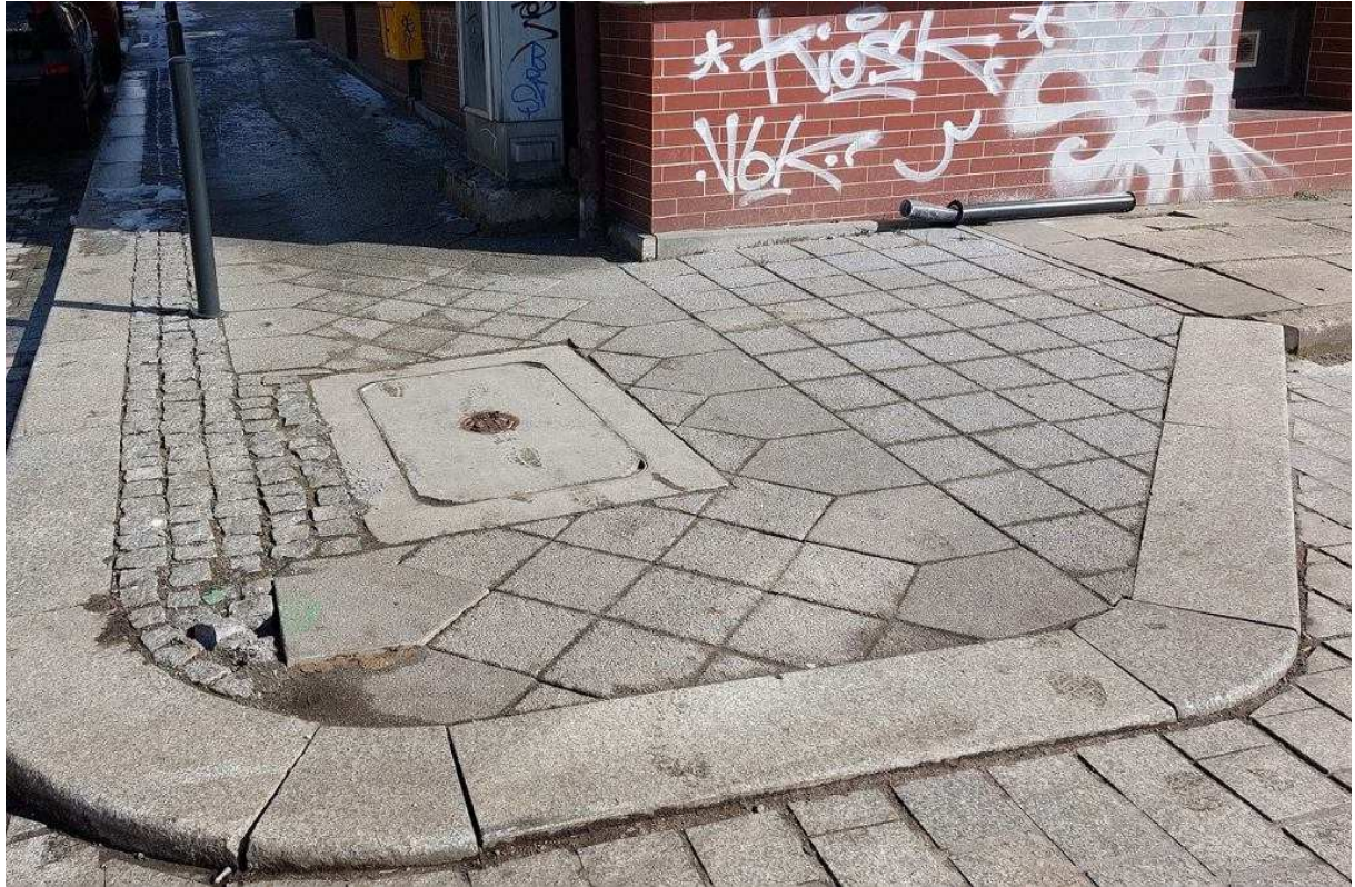
Zniszczone nowe słupki na Niebuszewie Tramwaje Szczecińskie