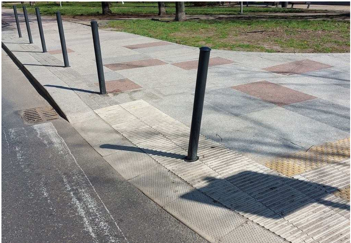
Zniszczone nowe słupki na Niebuszewie Tramwaje Szczecińskie