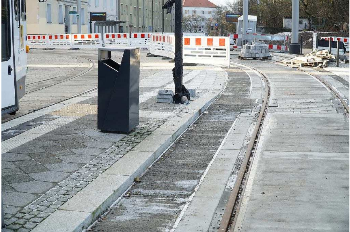
Przystanek końcowy przy Dworcu Niebuszewo. Przy jednym z peronów kostkę przy torach zastąpił beton Andrzej Kraśnicki jr