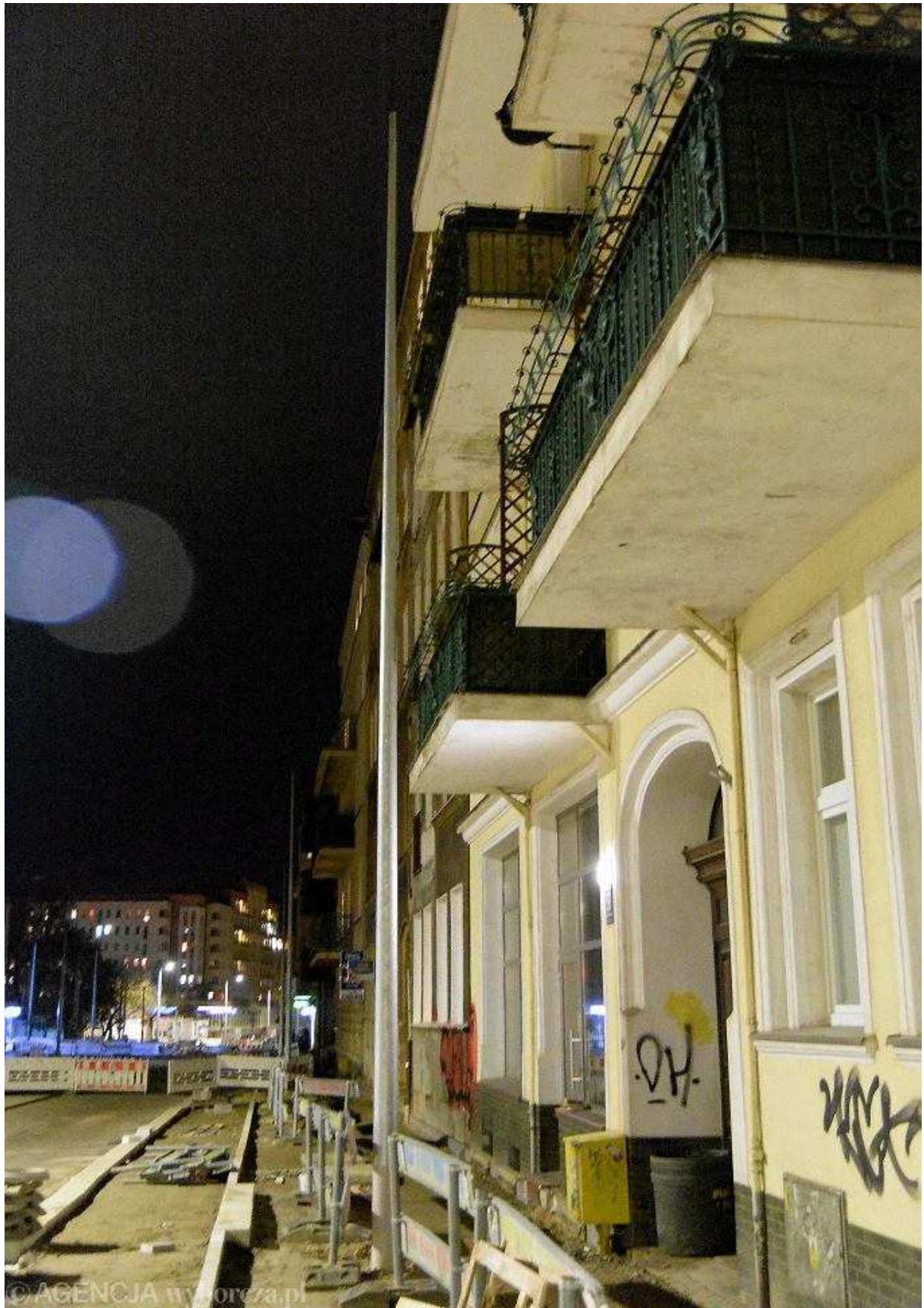
Słup trakcyjny tuż przy balkonach kamienicy na przebudowywanej al. Wyzwolenia w Szczecinie