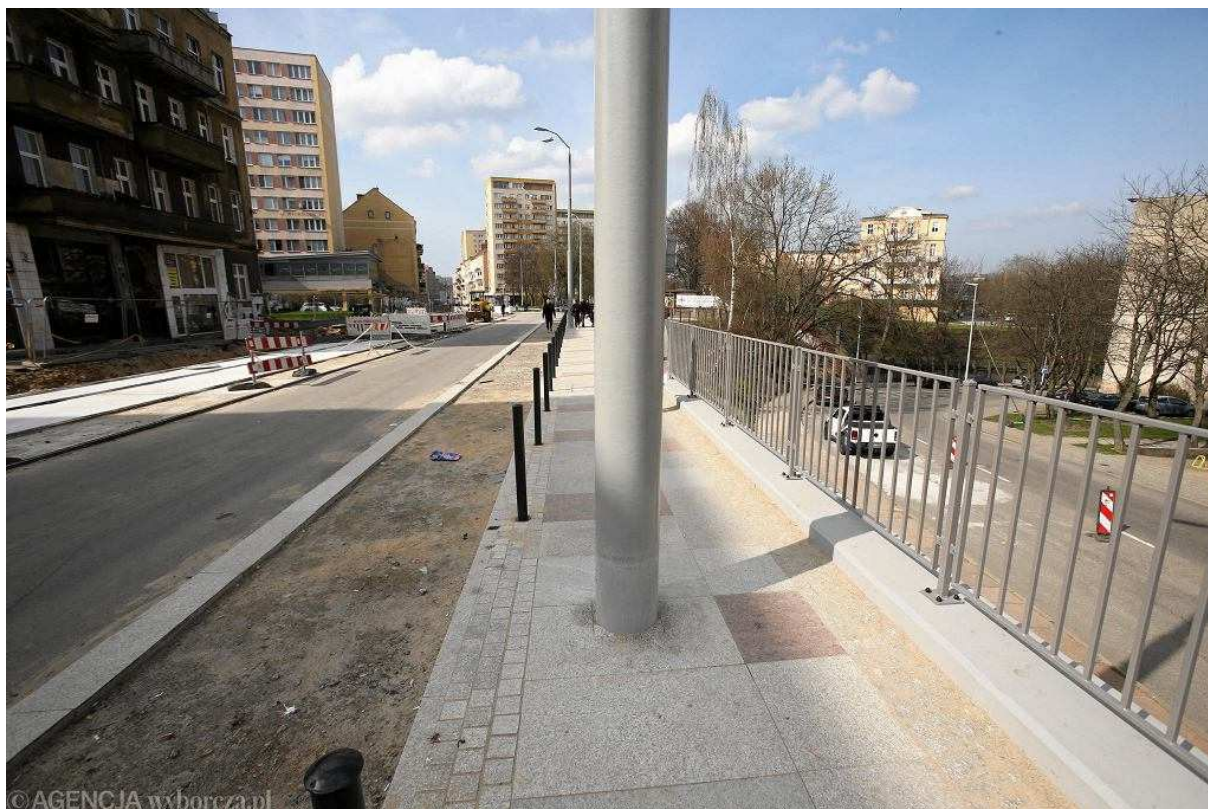
Al. Wyzwolenia w Szczecinie. Słupy lamp ulicznych zostały postawione niemal na środku chodnika