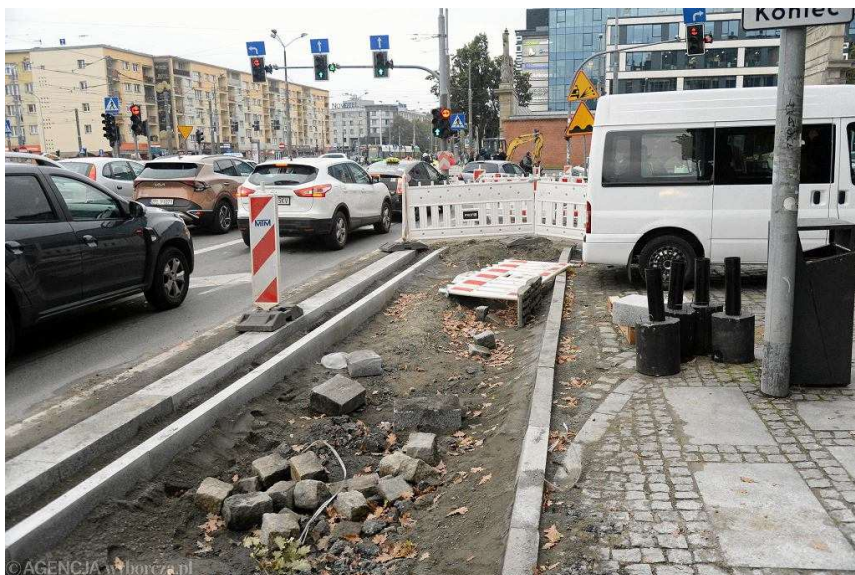
Remont placu Zwycięstwa w Szczecinie. Widok od strony al. Niepodległości z częściowo wytyczoną drogą rowerową przed prawoskrętem w kierunku placu