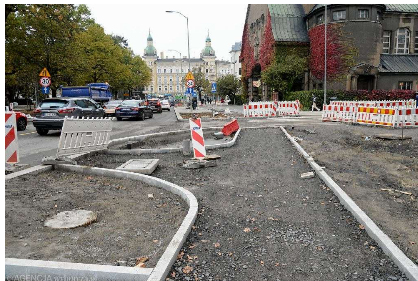
Remont placu Zwycięstwa w Szczecinie. Rejon kościoła pw. Najświętszego Serca Pana Jezusa.

Zgodnie z wcześniejszymi zapowiedziami remont powinien zakończyć się w listopadzie. Na jakim etapie są prace?