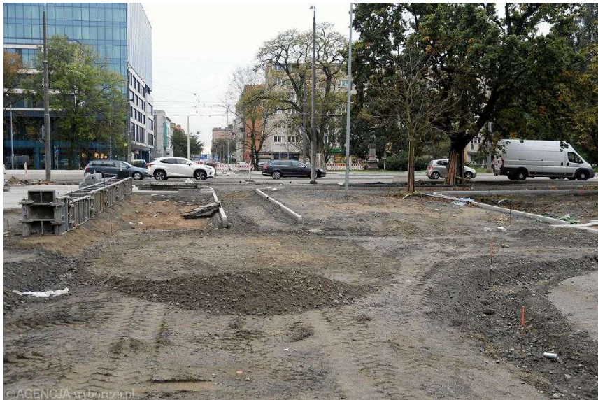
Remont placu Zwycięstwa w Szczecinie. Widok w kierunku ul. Kaszubskiej. Z lewej Posejdon