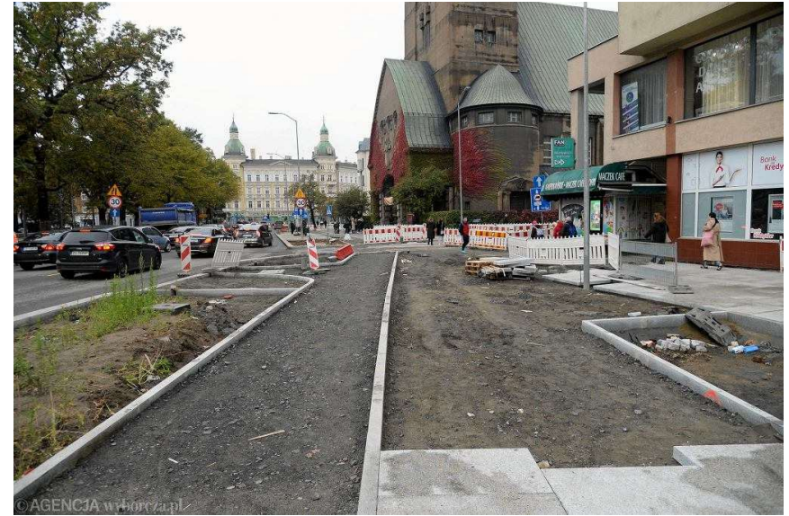
Remont placu Zwycięstwa w Szczecinie. Rejon kościoła NSPJ