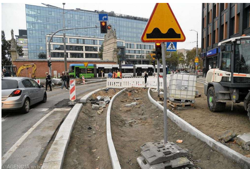
Remont placu Zwycięstwa w Szczecinie. Prawoskręt z al. Niepodległości w kierunku placu

Widoczny jest już docelowy układ chodników, miejsc parkingowych, jezdni na odcinku od ul. Kaszubskiej, koło Medicusa do al. Wojska Polskiego. Część chodników tutaj jest już gotowa (koło Medicusa), podobnie miejsca parkingowe. W wielu miejscach jednak piesi nadal chodzą wygrodzonymi barierkami ścieżkami.