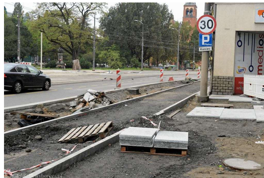
Remont placu Zwycięstwa w Szczecinie. Rejon w pobliżu Bramy Portowej w kierunku placu