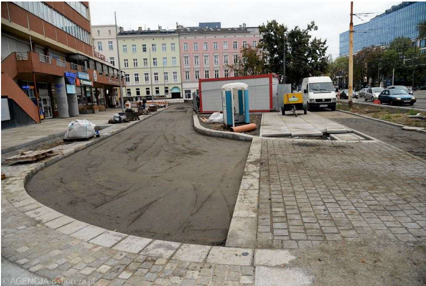
Remont placu Zwycięstwa w Szczecinie. Rejon Medicus

Sporo pracy jest także po drugiej stronie pl. Zwycięstwa, w rejonie dawnego hotelu Piast. Tu w większości nie ma jeszcze chodników, nie wszędzie są też wytyczone drogi rowerowe, a nawet jezdnie i chodniki.