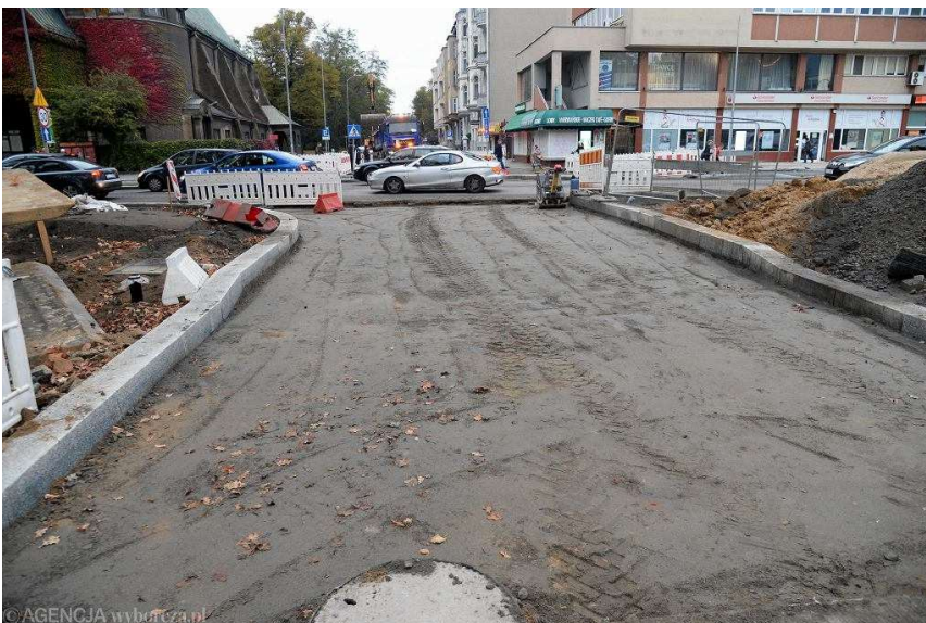
Remont placu Zwycięstwa w Szczecinie

Gdy w sobotę po południu byliśmy na miejscu, prace trwały w kilku miejscach placu - m.in. na prawoskręcie z al. Niepodległości w kierunku pl. Zwycięstwa, przy ul. Wojciecha, na skrzyżowaniu ulic Wojska Polskiego, Krzywoustego, Kopernika.