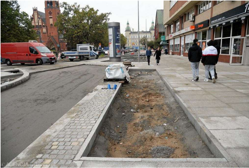
Remont placu Zwycięstwa w Szczecinie. Rejon Medicus