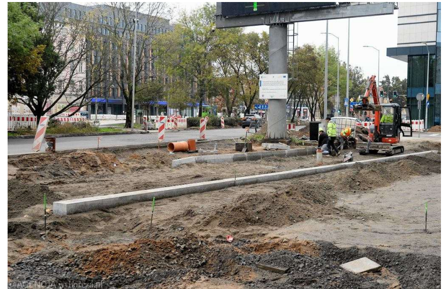
Remont placu Zwycięstwa w Szczecinie. Okolice dawnego hotelu Piast, przed Posejdonem