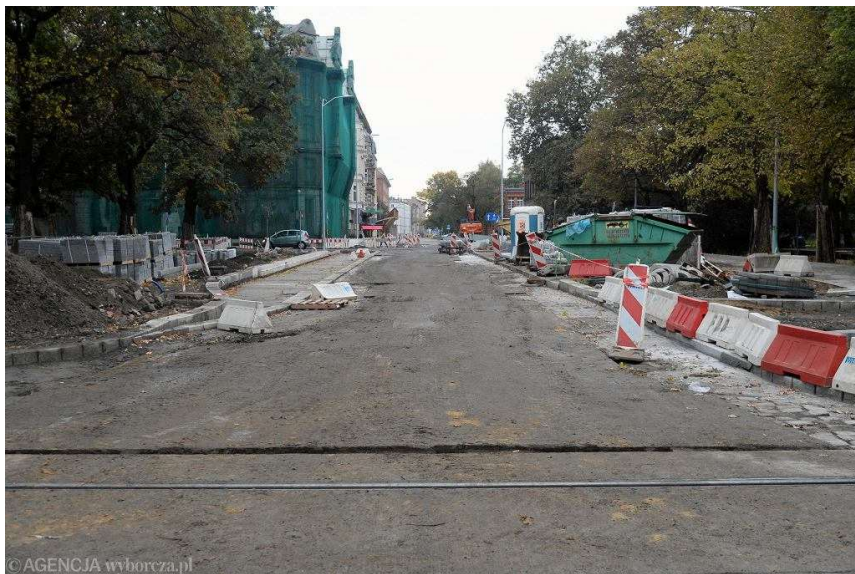
Remont placu Zwycięstwa w Szczecinie. Widok w kierunku ul. Kaszubskiej. Z lewej Posejdon