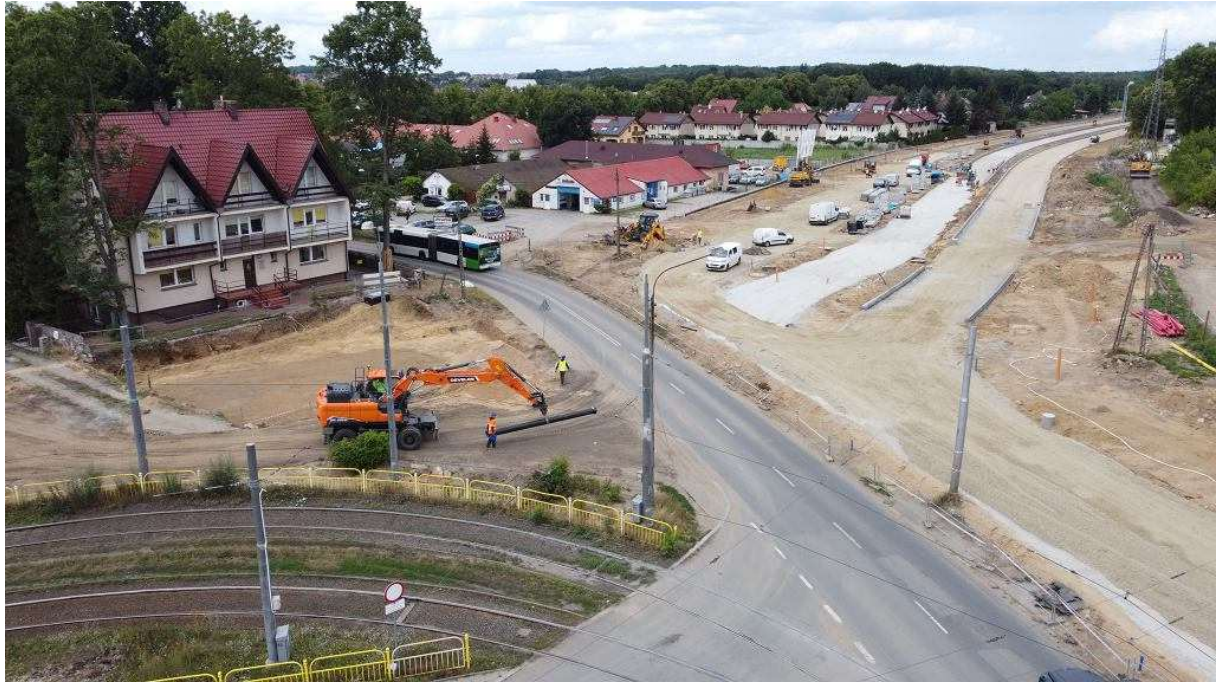
Pętla Krzekowo i budowa nowego odcinka ul. Sosabowskiego Andrzej Kraśnicki jr

Przejazd przez rejon pętli, która staje się częścią budowy nowego odcinka ul. Sosabowskiego, będzie po prostu niemożliwy. Przez plac budowy przejadą legalnie jedynie autobusy komunikacji miejskiej. Łamiący zakaz muszą liczyć się z tym, że tuż obok, kilkadziesiąt metrów od pętli Krzekowo, jest siedziba szczecińskiej straży miejskiej.