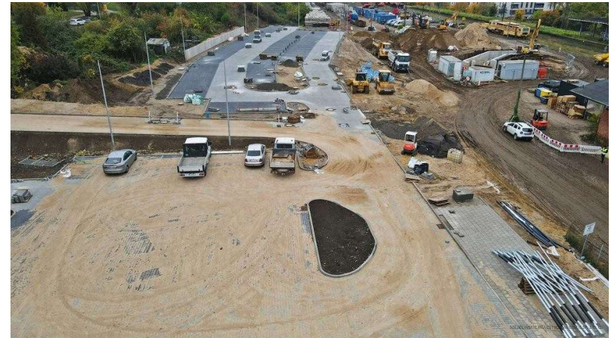
Szczecińska Kolej Metropolitalna. Prace przy stacji SKM Niebuszewo

posadowieniem i podłączeniem zbiorników retencyjnych. W większości zrealizowane są pozostałe prace instalacyjne sieci sanitarnych i teletechnicznych.