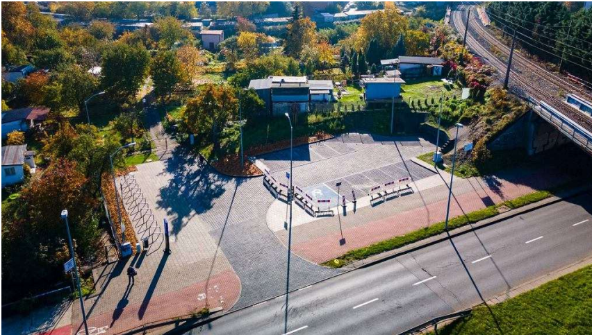
Szczecińska Kolej Metropolitalna. Zakończone prace przy przystanku SKM Pomorzany

Gotową infrastrukturę ma już około dziesięciu stacji w Szczecinie, to m.in. Łękno, Podjuchy, Niemierzyn (Arkońska), Pomorzany, Gocław, Zdunowo, Stołczyn Północny, Skolwin Północny.