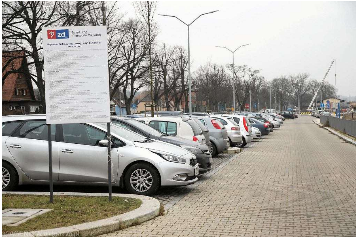
Zastawiony autami wojskowych parking przy stacji SKM Szczecin Podjuchy