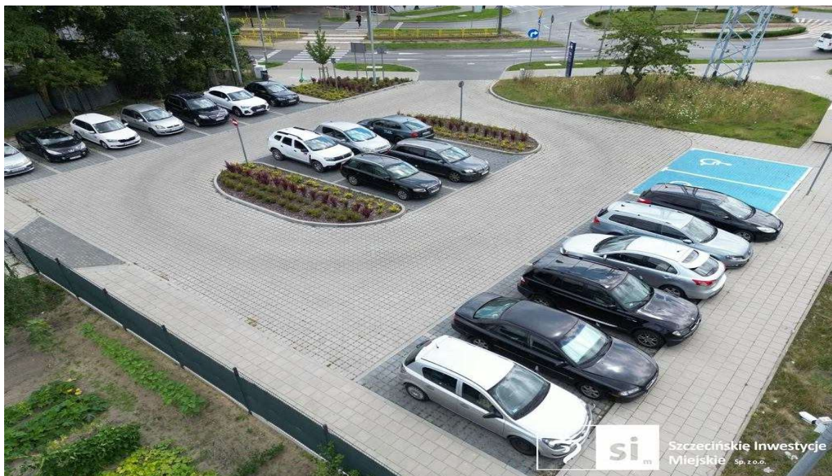
Parking przy przyszłej stacji SKM przy Cmentarzu Centralnym