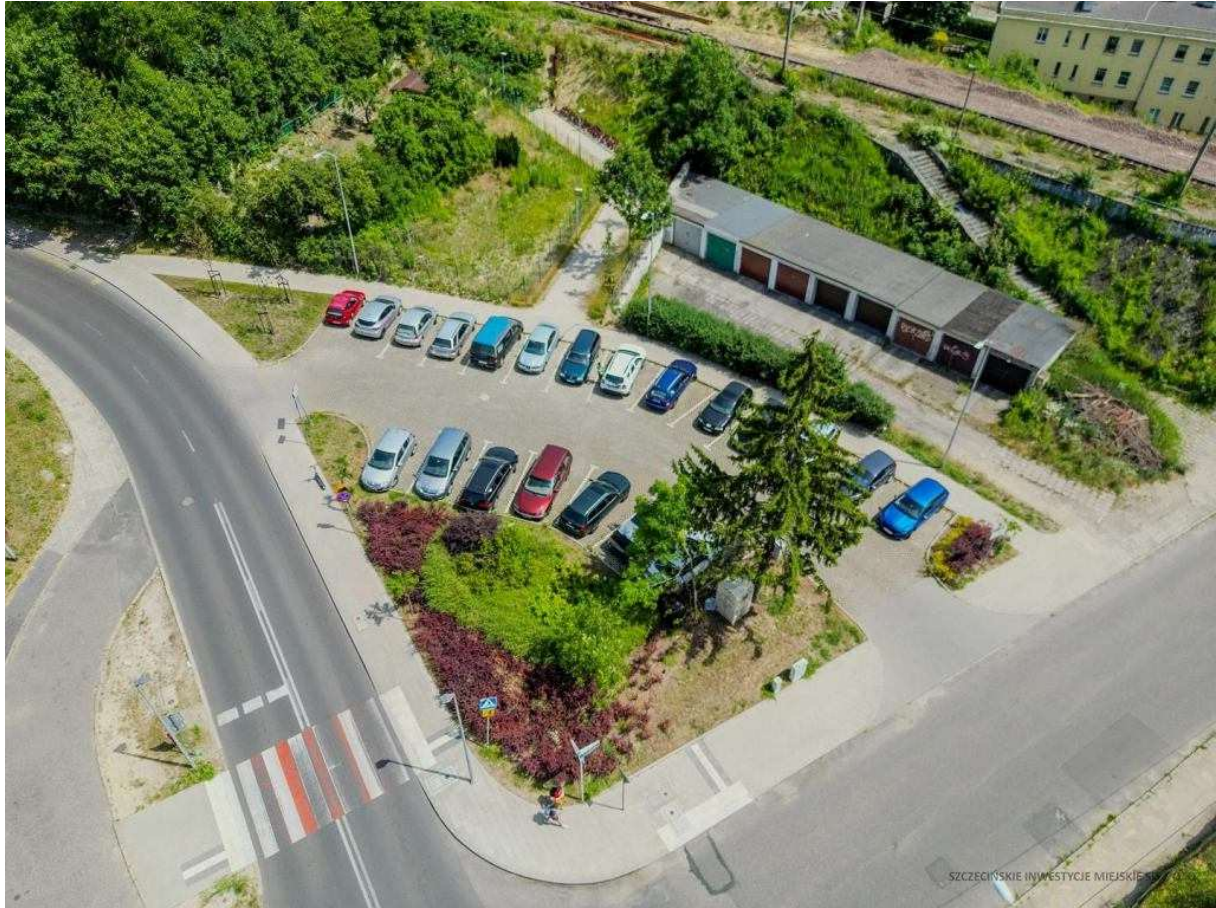
Parking przy przyszłej stacji SKM Drzetowo

Trzeba zauważyć, że znaczenie części tych parkingów jako miejsc przesiadkowych i tak będzie dość symboliczne. 19 miejsc (plus dwa dla osób niepełnosprawnych) przy ul. Sikorskiego, czy też 11 na Golęcynie tak naprawdę z parkingami park & ride z prawdziwego zdarzenia, ma niewiele wspólnego. Z dosłownie kilku miejsc przy przyszłym przystanku SKM Pomorzany korzystają już zaś zadowoleni działkowcy z pobliskich ogrodów. Na ich potrzeby to akurat wystarcza. Nie o to jednak chyba chodziło w całej wielkiej inwestycji.