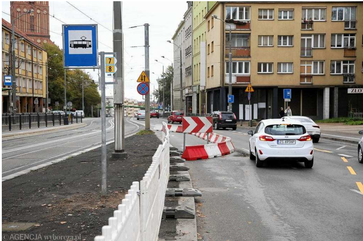
Przebudowa pl. Zwycięstwa w Szczecinie. Tymczasowy przystanek tramwajowy dla linii 7 i 8 na Bramie Portowej w kierunku prawobrzeża z wygodzoną częścią jezdni