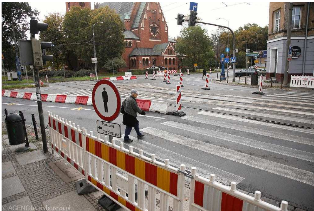
Przebudowa pl. Zwycięstwa w Szczecinie. Zmiana organizacji ruchu. Zamknięte przejście dla pieszych przez ul. Krzywoustego

Do godz. 12 w niedzielę przez ul. Krzywoustego nie kursują jeszcze tramwaje linii 7, 8 i 9. Zamiast „ósemki” na trasie Gumieńce – Brama Portowa co 20 minut jeździ autobus 808, a „siódemka” i „dziewiątka” jeżdżą objazdem.