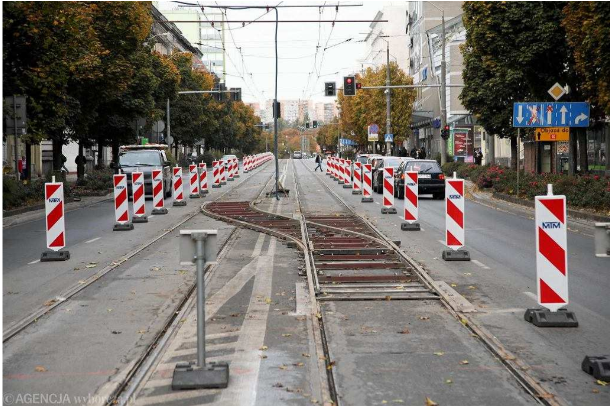
Przebudowa pl. Zwycięstwa w Szczecinie. Zmiana organizacji ruchu. Torowa nakładka rozjazdowa na ul. Krzywoustego

przystanków przy Bramie Portowej . Na tym odcinku tramwaje będą jeździć wahadłowo jednym torem.