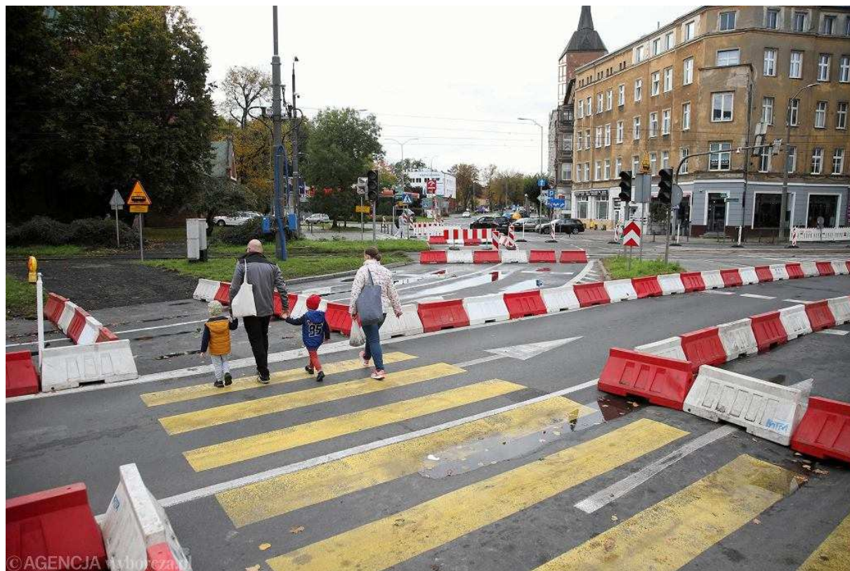
Przebudowa pl. Zwycięstwa w Szczecinie. Zmiana organizacji ruchu. Tymczasowe przejście na wysokości al. Wojska Polskiego

Na placu Zwycięstwa zaszła jeszcze istotna zmiana dla pieszych. Zamknięte zostało przejście przez ul. Krzywoustego na wysokości salonu ProMedia. Zamiast niego powstało tymczasowe przejście na wysokości al. Wojska Polskiego.