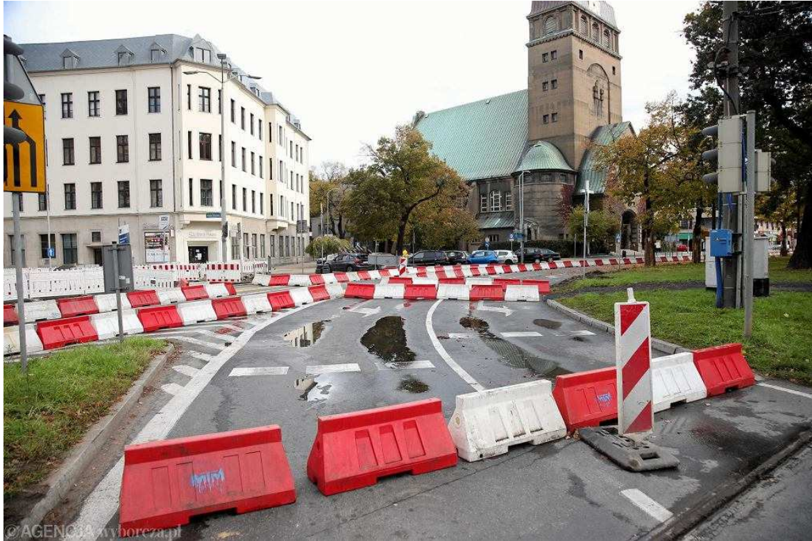
Przebudowa pl. Zwycięstwa w Szczecinie. Zmiana organizacji ruchu. Zamknięty lewoskręt w ul. Kopernika

Wyłączona została też sygnalizacja świetlna na skrzyżowaniu placu Zwycięstwa z ul. Krzywoustego oraz na skrzyżowaniu placu Zwycięstwa z ul. św. Wojciecha.