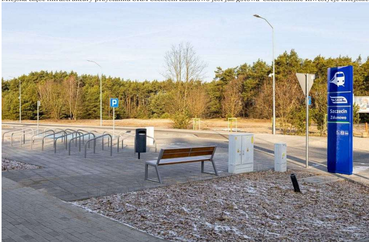
Miejska część infrastruktury przystanku SKM Szczecin Zdunowo jest już gotowa Szczecińskie Inwestycje Miejskie

W Zdunowie Bartek wsiadał do pociągu jadącego do stacji Szczecin Główny. Po 20 minutach był w śródmieściu.