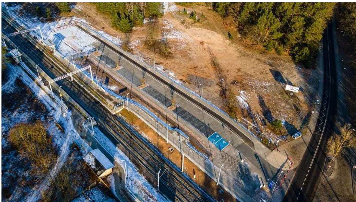
Miejska część infrastruktury przystanku SKM Szczecin Zdunowo jest już gotowa Szczecińskie Inwestycje Miejskie