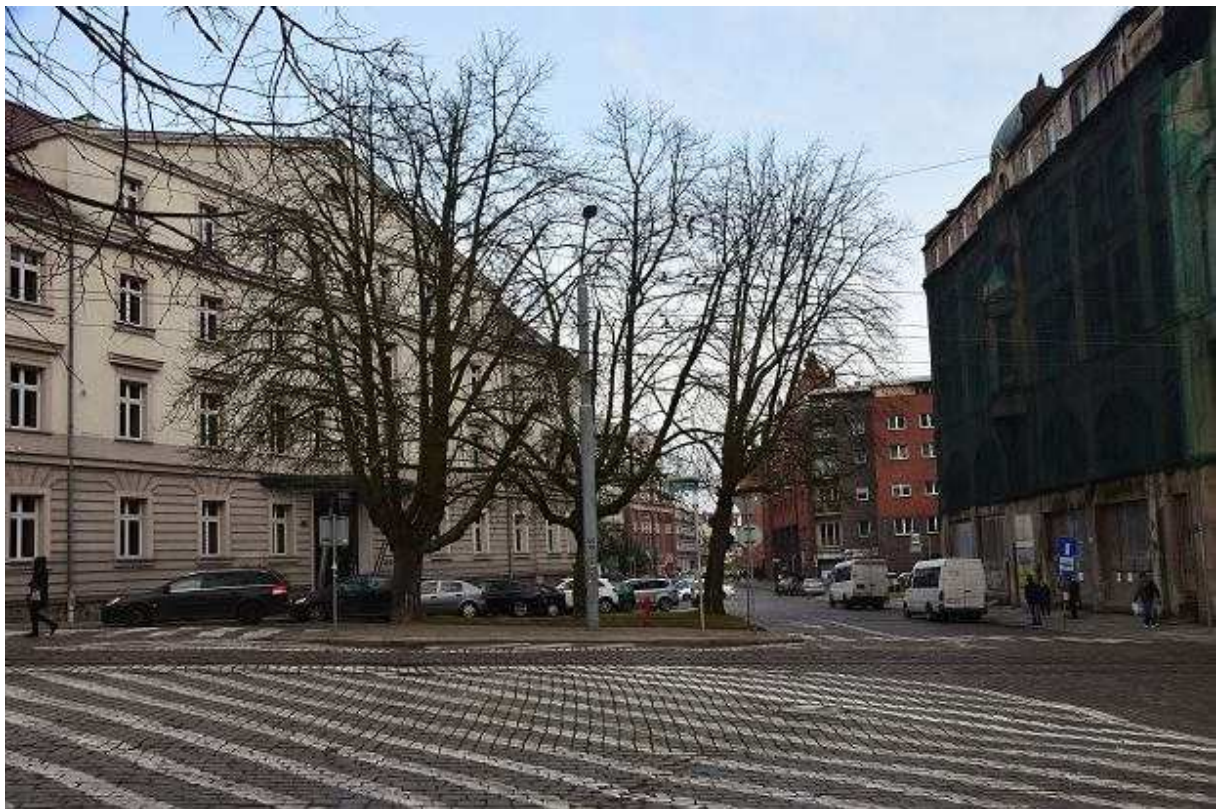
Skrzyżowanie ul. Dworcowej i Św. Ducha. Dwa z trzech kasztanowców mają być wycięte Andrzej Kraśnicki jr

Naszą uwagę od razu zwrócił los trzech kasztanowców zwyczajnych, które rosną na trójkątnej wyspie u wlotu w ul. Św. Ducha od strony ul. Dworcowej. To rosłe, wiekowe drzewa. W projekcie wszystkie trzy zostały przeznaczone do wycinki. Powód? Jak czytamy w opisie: „drzewo w odległości mniejszej niż 3 m od jezdni”.