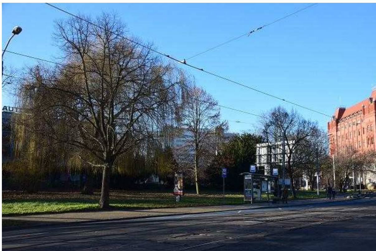
Ulica Nowa. Dwa drzewa przeznaczone do wycinki (to z lewej i to na prawo od wiaty) Andrzej Kraśnicki jr

To zresztą niejedynie drzewa w tym rejonie wskazane do wycinki. W planie jest również usunięcie dwóch lip, które rosną przy przystanku tramwajowym przy ul. Nowej (na wysokości dworca PKS). W ich przypadku powodem ma być „kolizja” z nowym chodnikiem. Stan obu drzew jest określony jako dobry. W dokumentach nie ma jeszcze decyzji Urzędu Marszałkowskiego w sprawie tych drzew.