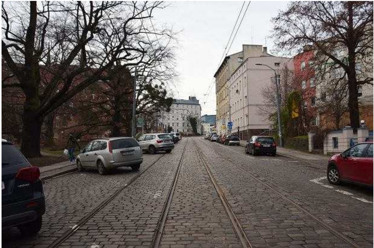
Ulica Dworcowa z torami zbudowanymi w 1948 roku Andrzej Kraśnicki jr

Dlaczego w ogóle kasztanowce mają coś wspólnego z modernizacją torowisk? Chodzi o przebudowę istniejącego torowiska w ciągu ul. Dworcowej – od Nabrzeża Wieleckiego do ul. 3 Maja. Są tu dwa tory, z których wykorzystywany jest tylko ten prowadzący pod górę. To zresztą kawał ciekawej historii Szczecina. Tory na tym odcinku zbudowane zostały w 1948 roku. Wykorzystano szyny pochodzące ze likwidowanej linii tramwajowej wzdłuż ul. Emilii Plater i Staszica.