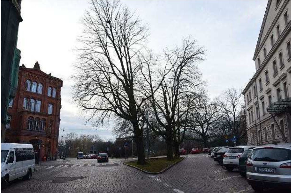
Skrzyżowanie ul. Dworcowej i Św. Ducha. Dwa z trzech kasztanowców mają być wycięte Andrzej Kraśnicki jr