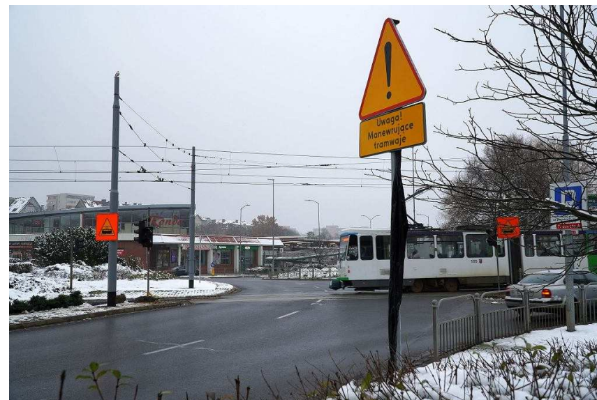
Oznakowanie ostrzegające przed tramwajami na rondzie Giedroycia Andrzej Kraśnicki jr

Przejście z autobusu 812 jadącego od strony centrum do tramwaju 3 Andrzej Kraśnicki jr Dość nietypowy ruch tramwajowy na rondzie (widok tramwaju jadącego na wstecznym może zaskoczyć) będzie wspomagany przez tymczasową sygnalizację. Światła – zarówno dla kierowców jak i motorniczych – były ustawione już w niedzielę. Są też już (na razie częściowo zasłonięte) znaki ostrzegające przed manewrującymi tramwajami.