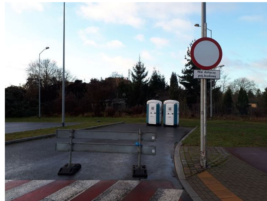
Od strony ul. Arkońskiej, gdzie kończy się obwodnica, stanęły przenośne toalety