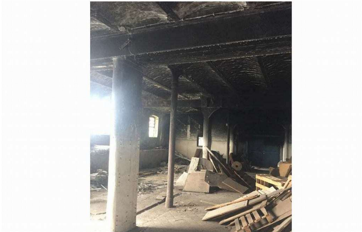
Dawna stajnia budynku przy ul. Kolumba