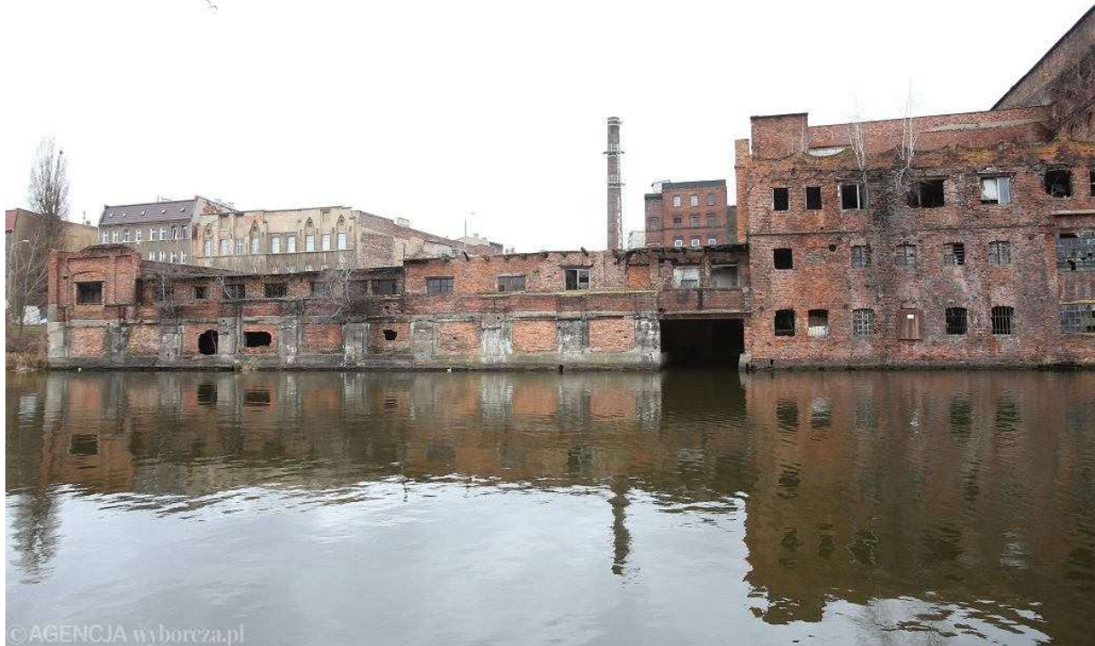
Przyszła siedziba Wód Polskich

Pierwsze przymiarki do inwestycji w tym miejscu zaczęły się w 2017 roku, kiedy to pojawiły się plany zlokalizowania w tym miejscu Urzędu Żeglugi Śródlądowej. Nieruchomość wyceniona na 675 tys. zł należała do miasta. Została przekazana skarbowi państwa, pod siedzibę urzędu, za symboliczną złotówkę. W zamian miasto – także za złotówkę, otrzymało działkę przy ul. Władysława IV na Łasztowni wycenianą z kolei na 4 mln zł.