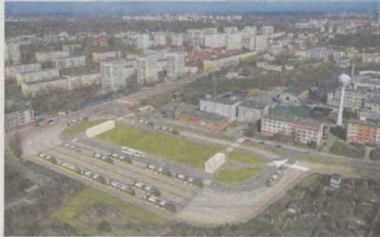
Tak ma wyglądać po przebudowie nowa pętla tramwajowa na Pomorzanych

Cała inwestycja powinna być przeprowadzona najpóźniej do końca 2023 r., o ile miasto chce wykorzystać zabezpieczoną na ten cel pulę pieniędzy z funduszy Unii