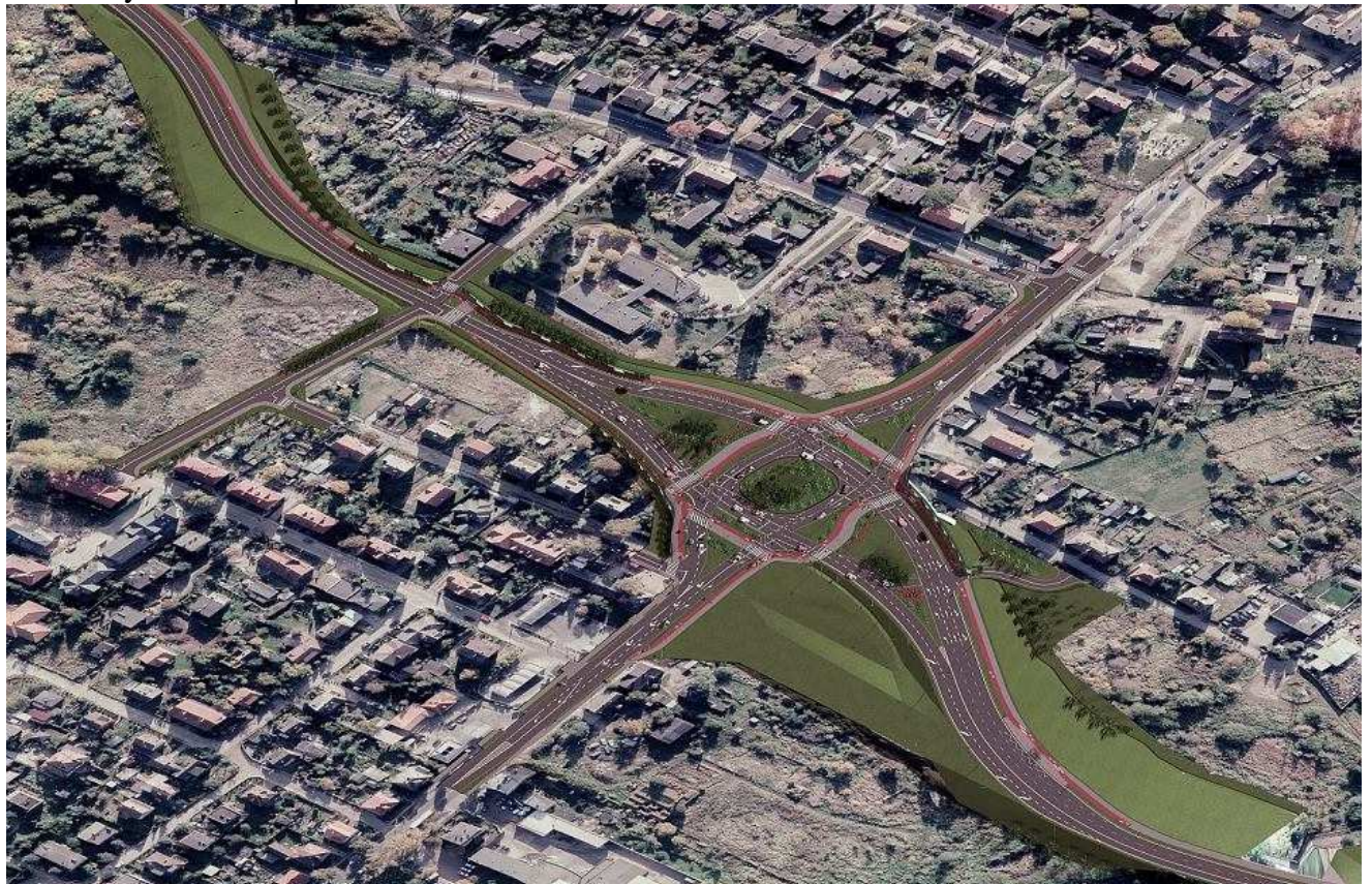
Wizualizacja węzła w Podjuchach (Urząd Miasta)

Powstanie kolejny most nad Regalicą, nowe, wielkie skrzyżowanie i nowe połączenie z autostradą A6. Miasto ogłosiło w środę przetarg na rozbudowę skrzyżowania ul. Floriana Krygiera z ul. Granitową.