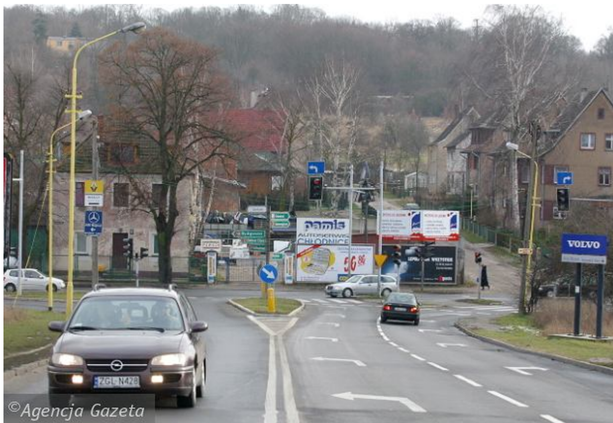
Skrzyżowanie ul. Granitowej z dawną Autostradą Poznańską (obecnie Krygiera) w Podjuchach