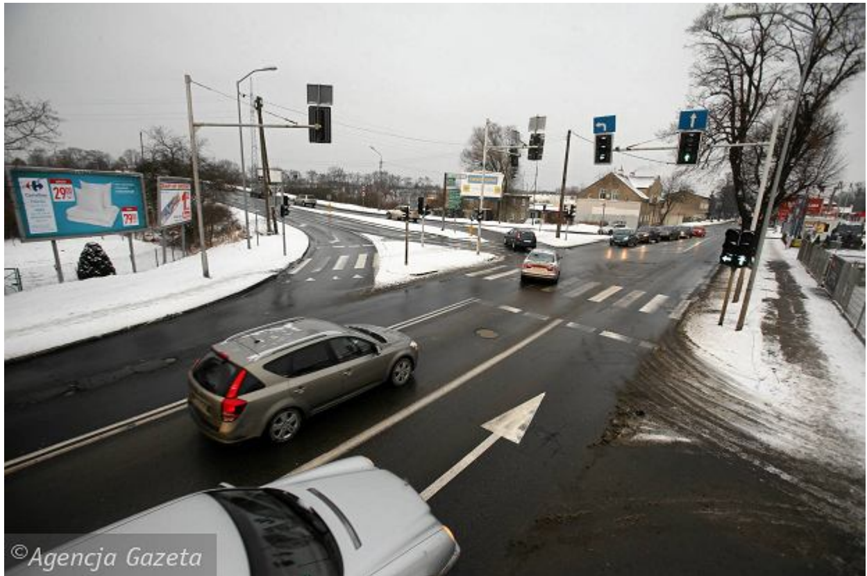
Skrzyżowania ul. Krygiera z Granitową. Stan obecny CEZARY ASZKIEŁOWICZ