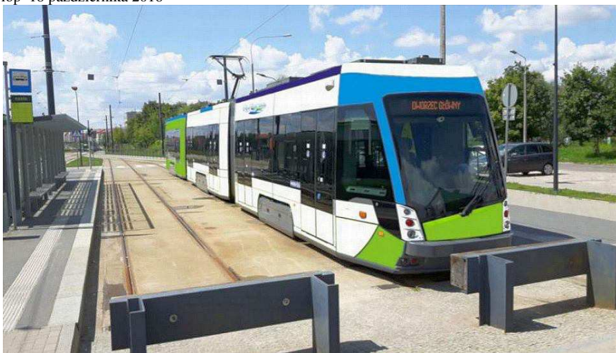
Dwukierunkowy tramwaj na torze odstawczym na końcowym przystanku na os. Kaliny (Wizualizacja z zasobów UM)

Nowa linia tramwajowa ma kursować od dworca Szczecin Główny do skrzyżowania ulic Witkiewicza z Derdowskiego. Od ul. 26 Kwietnia będzie poruszać się całkiem nowym torowiskiem. Wiadomo już, gdzie będą i jak mają wyglądać poszczególne przystanki